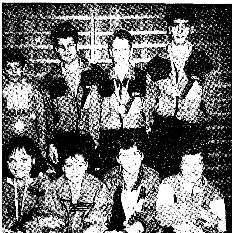
Die niederösterreichischen Teilnehmer bei den Österreichischen Schülertischtennismeisterschaften,