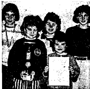
Oberndorfs Mädchen holten den Schul-Landesmeistertitel.