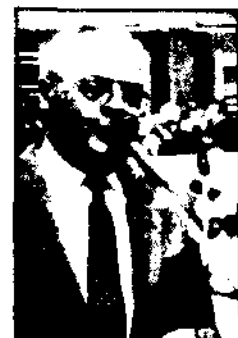
LH-Stellvertreter Leopold Grünzweig eröffnete die Sporthalle.

Leistungszentren Damen-Judo und Tischtennis hatten keine Heimstätte, nun erhalten sie Leistungszentren in Stockerau. Die Vierfach-Kegelbahn soll zur Freude am Sport auch Einnahmen bringen.