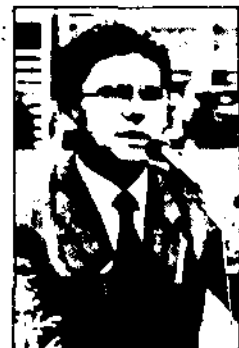
Bürgermeister Richteritzky bei der Halleneröffnung

Möge ein larer Sport die Menschen näher zueinander bringen. Das Zueinanderfinden im olympischen Geiste könnte eine Grundlage für eine schöne Zukunft sein! H. G.